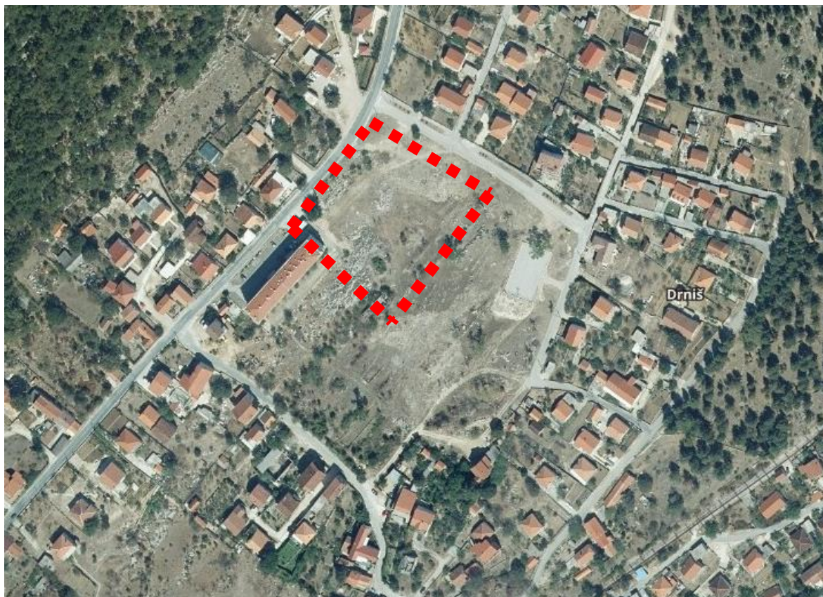
Obuhvat izmjena i dopuna na izvodu iz Geoportala – DGU ( https://geoportal.dgu.hr/ )

Obzirom da je iskazana potreba za stvaranjem uvjeta za realizaciju doma za starije i nemoćne na predjelu „Pazara“, potrebna je promjena namjene i uvjeta gradnje.