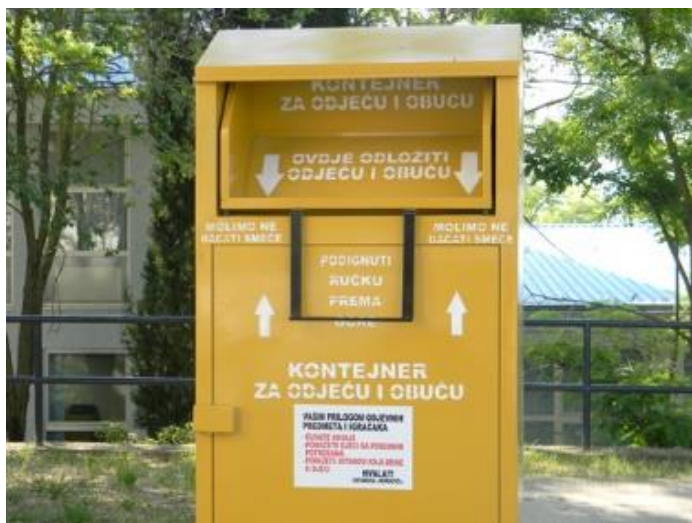
Slika 3. Izgled karakterističnih spremnika od kojih se sastoje zeleni otoci

U papirnati i kartonski otpad koji se može odložiti u zelenim otocima spadaju: