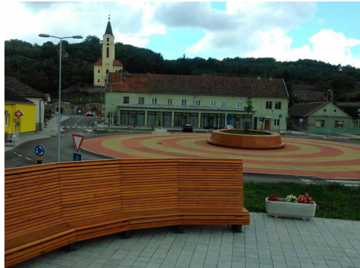
Dunavski pogled – uređenje javne turističke infrastrukture u mjestu Batina