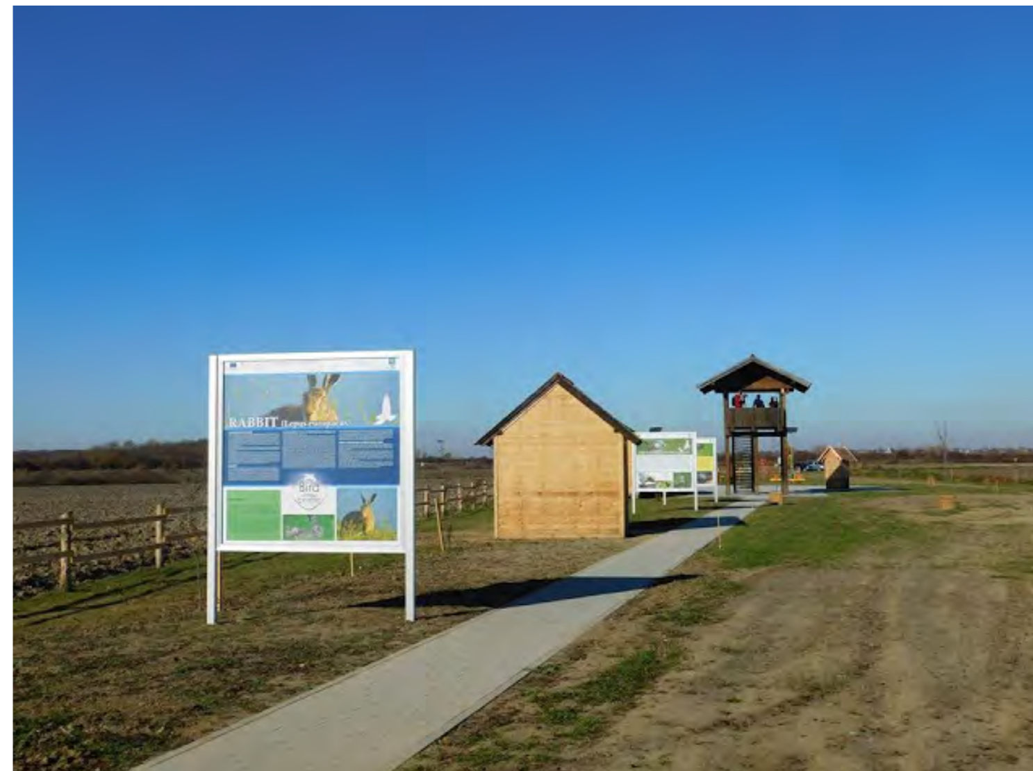
Centar za promatranje ptica