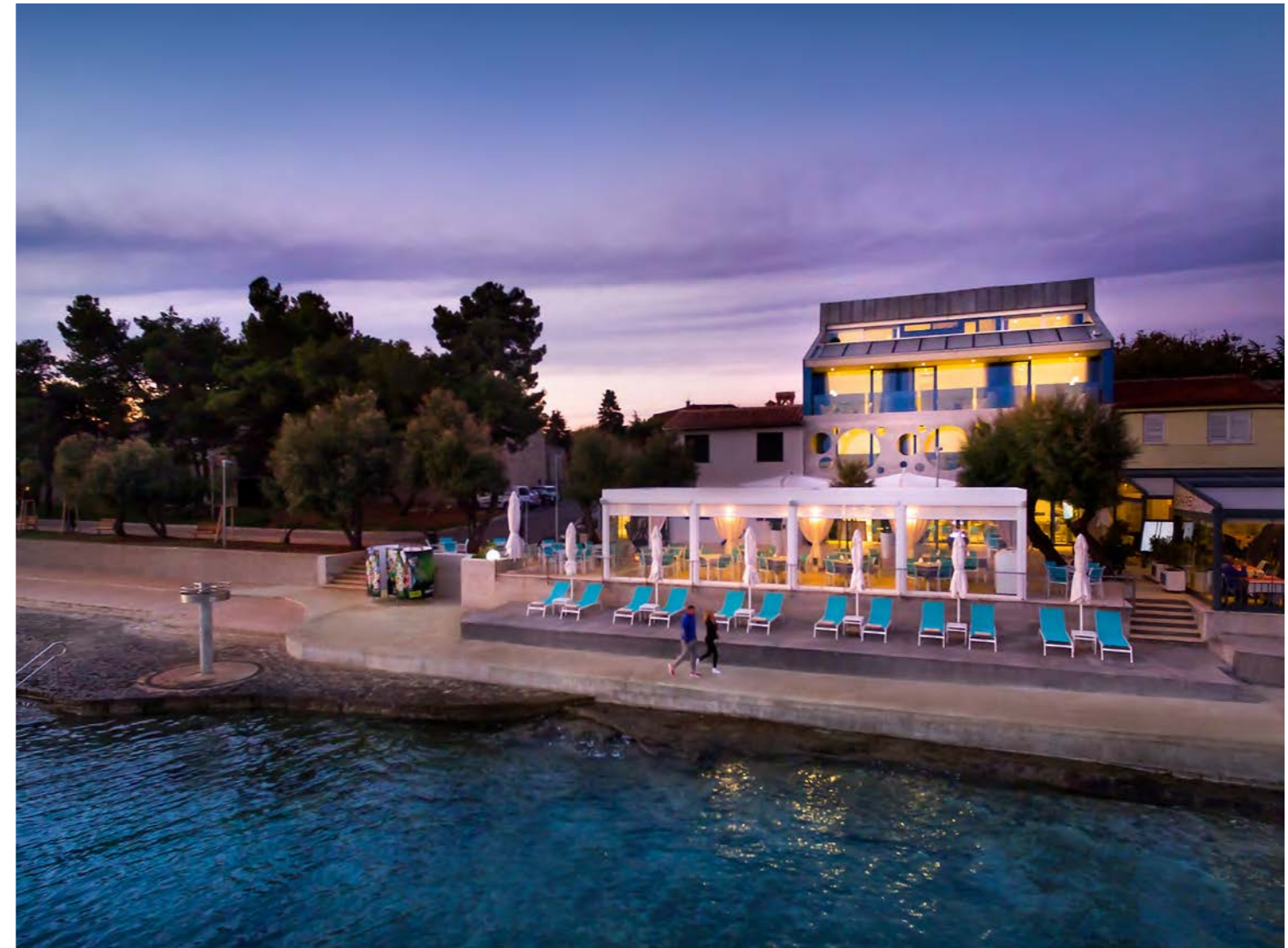
Dizajn butik hotel "Rivalmare" 4* u Novigradu