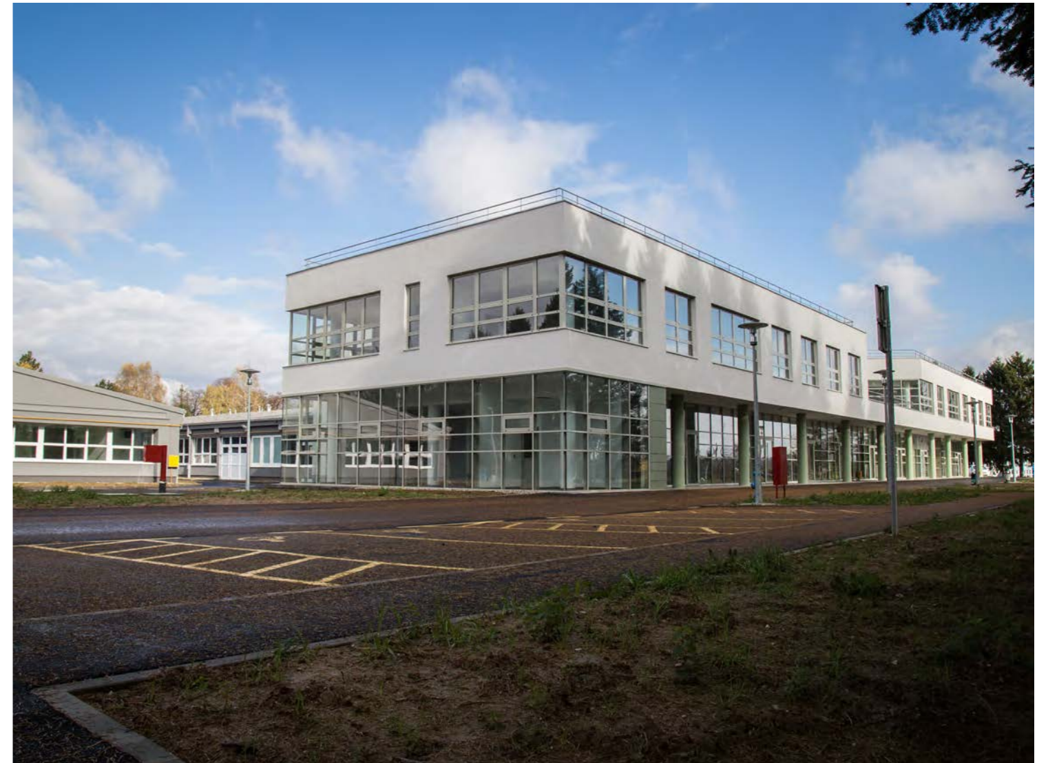
Razvojni centar i tehnološki park Križevci