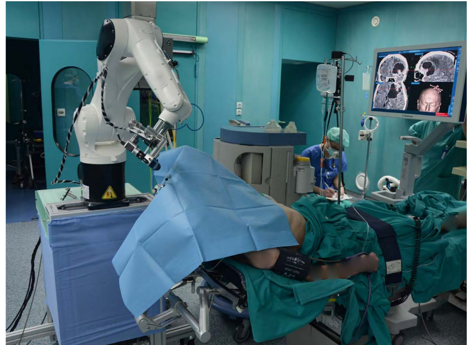
RONNA Robotska neuronavigacija