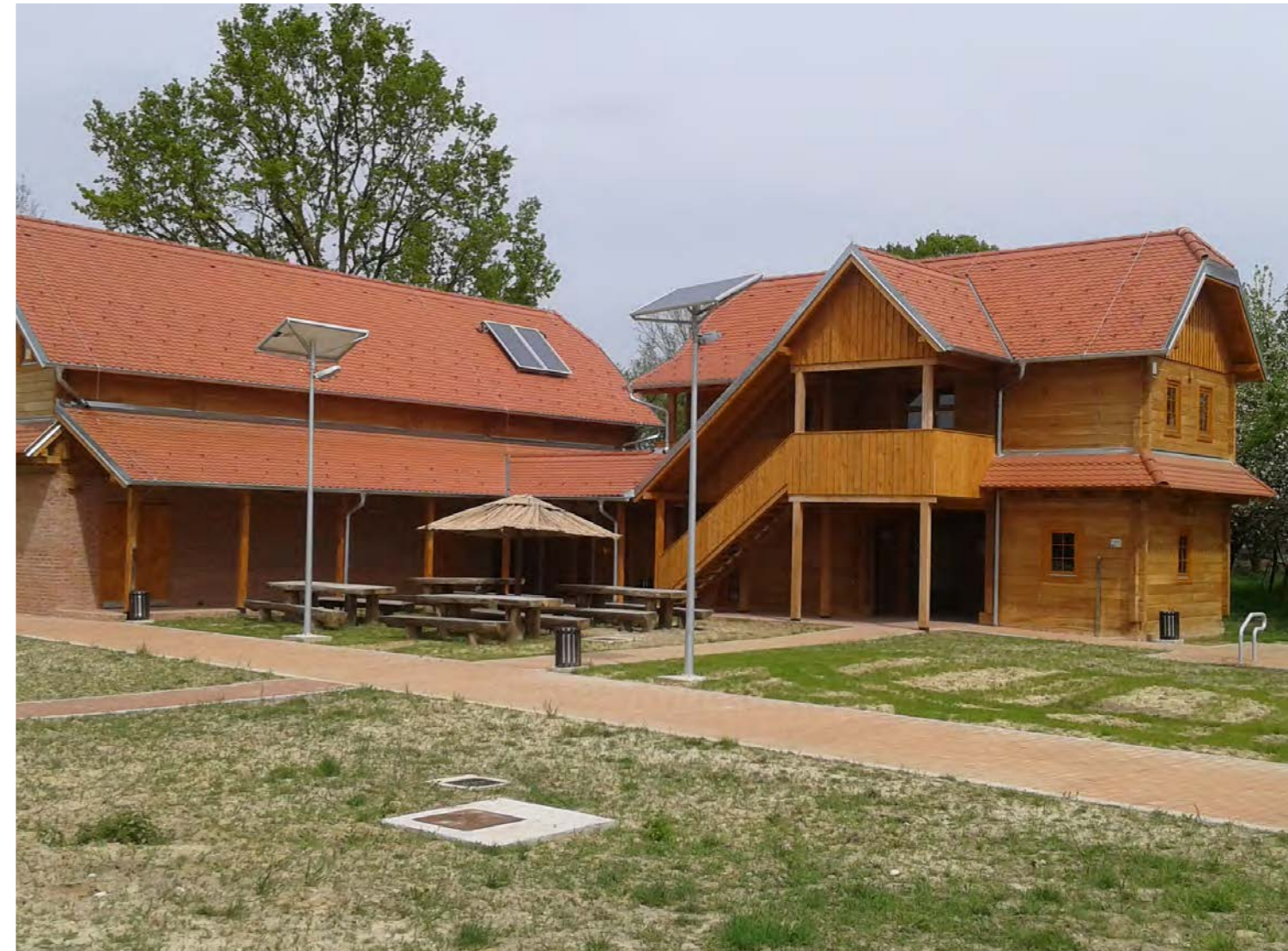
Prijamni centar Repušnica – moslavačka vrata u Park prirode Lonjsko Polje