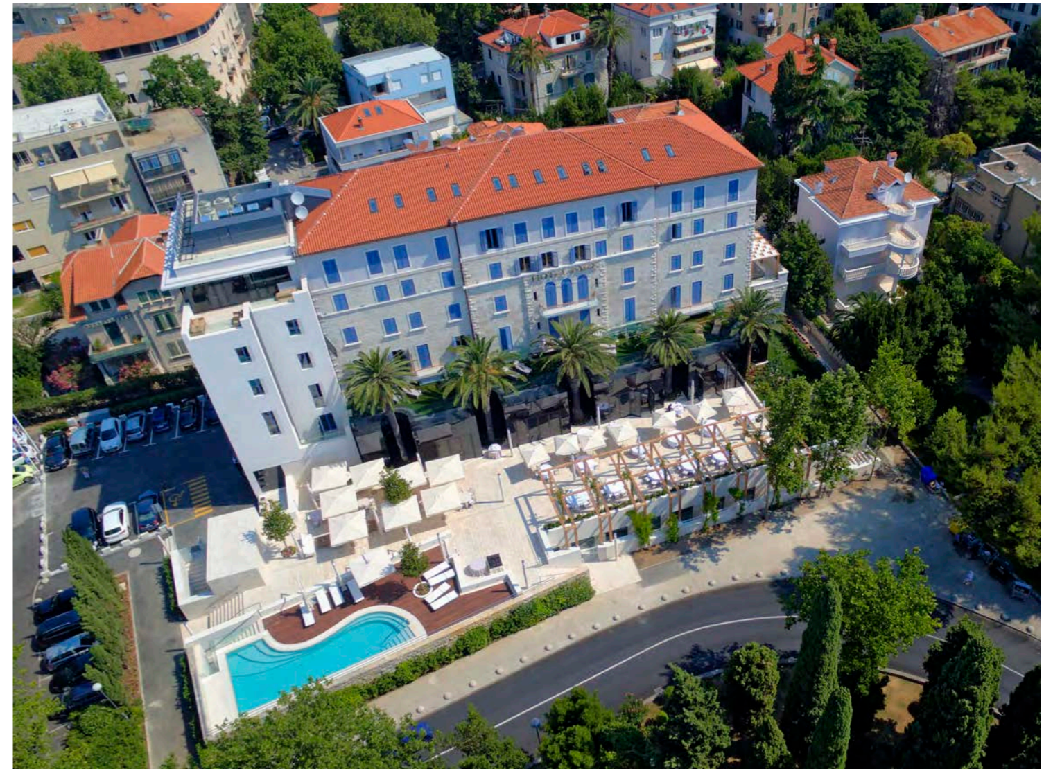
Renovacija i rekonstrukcija hotela "Park" u Splitu