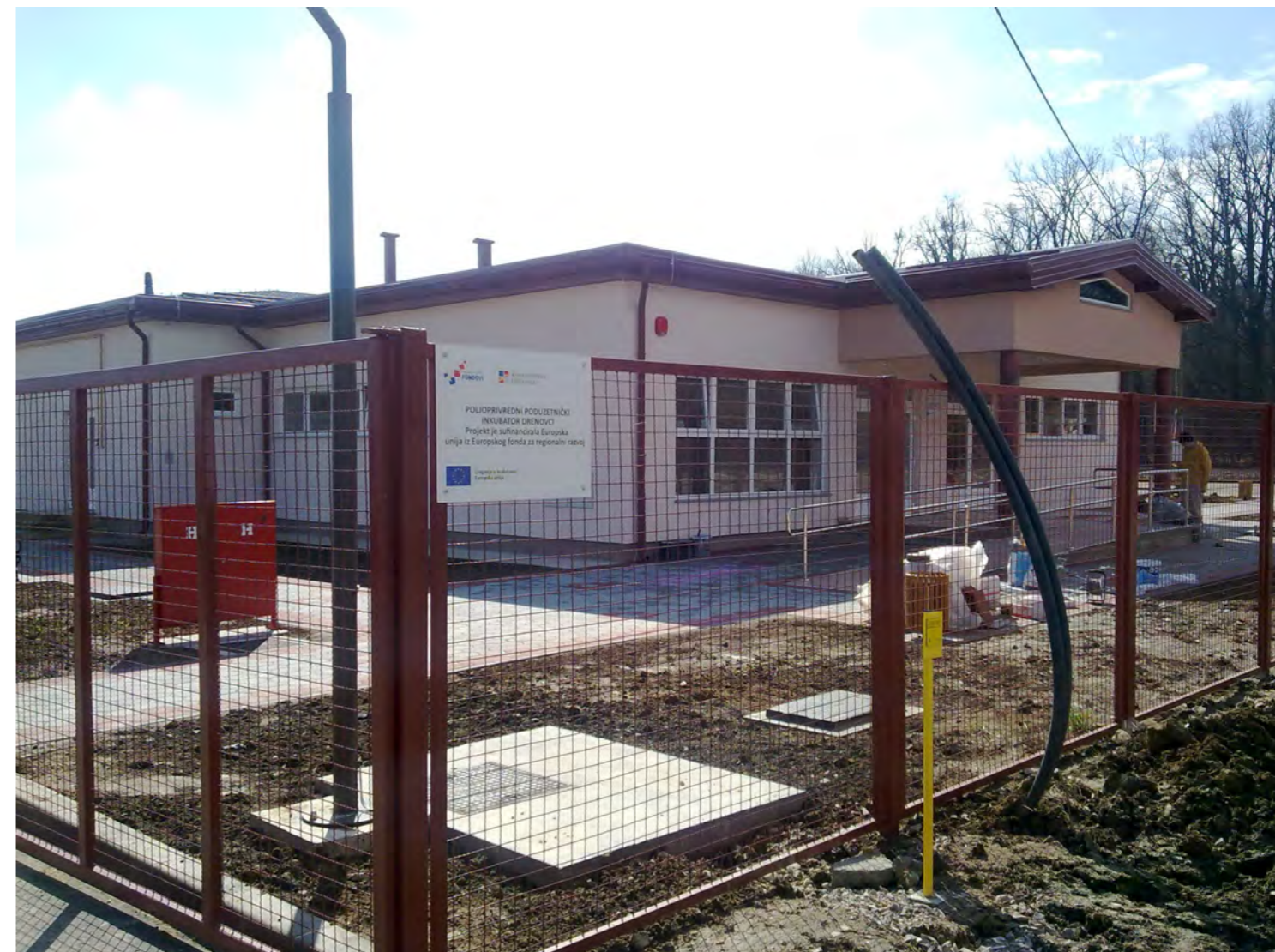
Poljoprivredni poduzetnički inkubator Drenovci