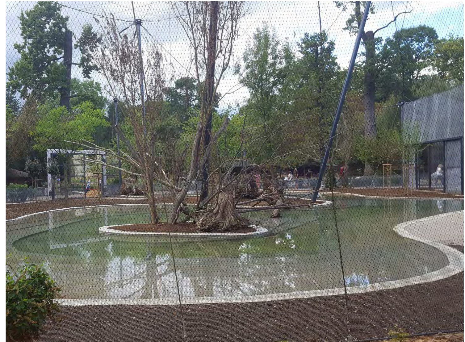
Modernizacija Zoološkog vrta u Zagrebu prva faza