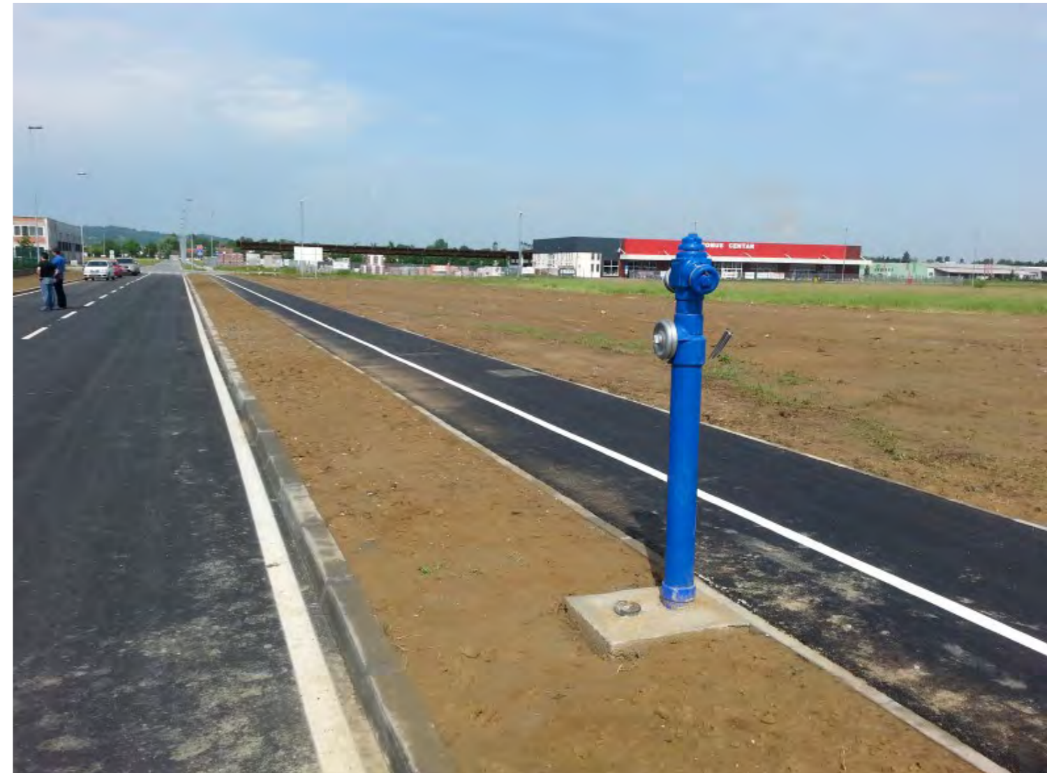
Izgradnja pristupnih cesta parcelama u Poduzetničkoj zoni III Faze II. i IV.