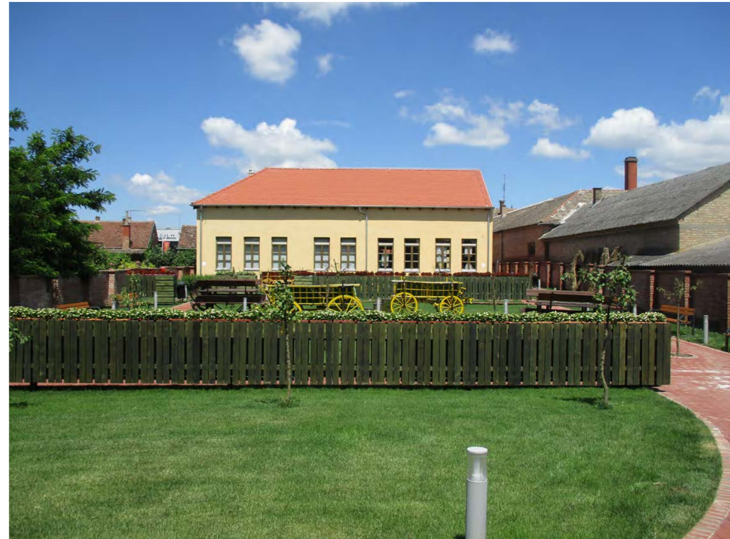
Etnološki centar baranjske baštine