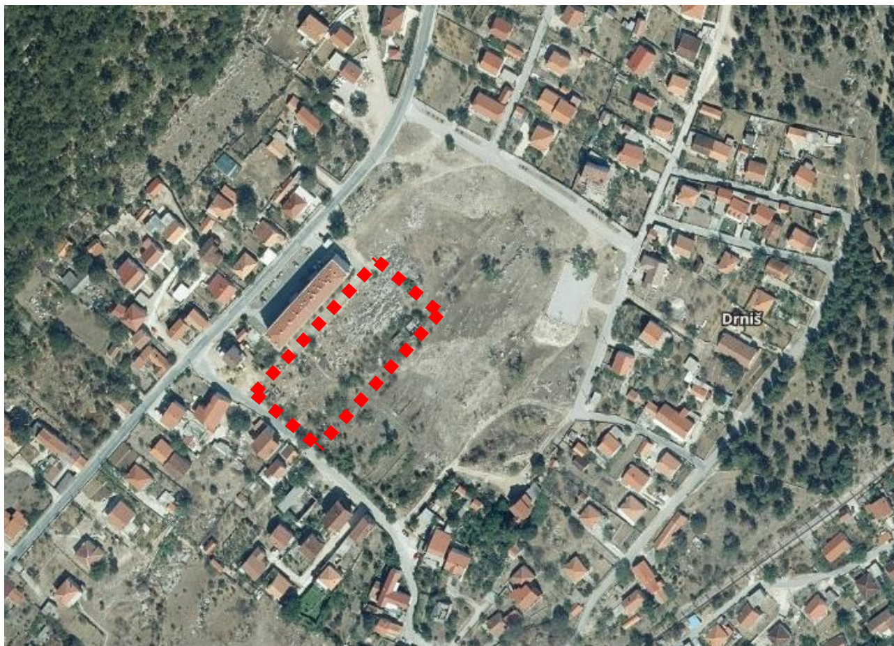
Obuhvat izmjena i dopuna na izvodu iz Geoportala – DGU ( https://geoportal.dgu.hr/ )

Obzirom da je iskazana potreba za stvaranjem uvjeta za realizaciju višestambene izgradnje na predjelu „Pazara“, potrebna je promjena namjene i uvjeta gradnje.